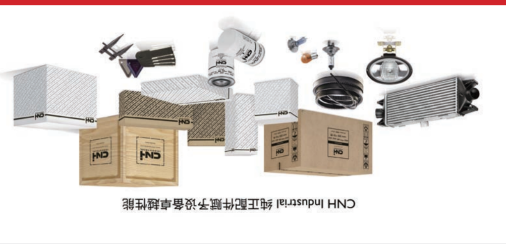
CNH Industrial 纯正配件赋予设备卓越性能

中国客户打造的数字化车联网平台, 用户可以通过智能手机、平板或电脑随时随地查看自己机器的状态和作业情况, 如实时地理位置信息, 作业轨迹, 车辆实时及历史数据。