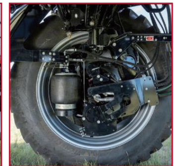
飞机地轮式的减震结构