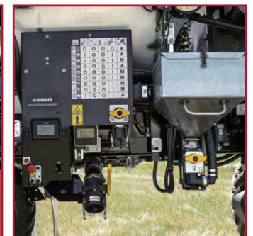
一站式的保养中心