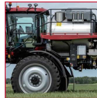
发动机后置 + 药箱中置

对于种植者来讲, 重要的是在合适的农艺窗口进行合适的作物管理。这就需要一台可以提供持续, 精准作业的机器, 在整个季节可以可靠地工作。这就是“爱国者”喷药机设计理念所在。凯斯“爱国者”喷药机已经有了近 30 年的历史。